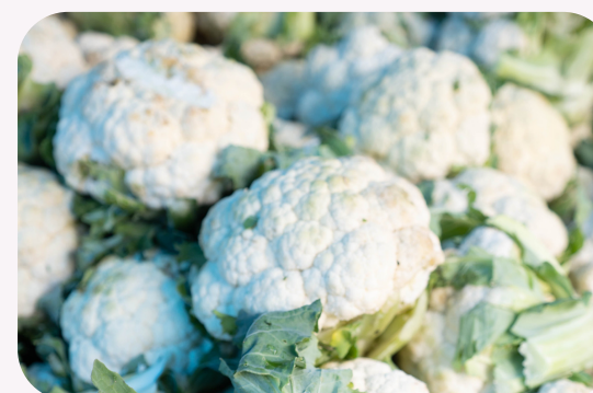
Coliflor ( Brassica oleracea var. Botrytis )

Empanadillas caseras al horno rellenas de lombarda y manzana